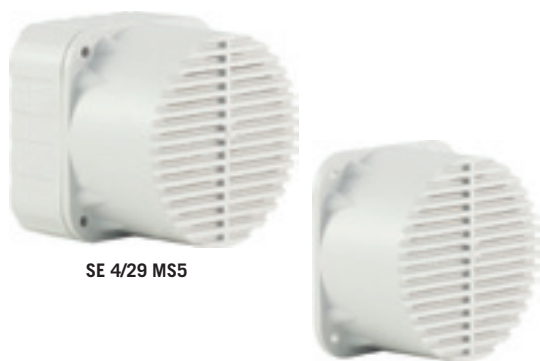
SE 4/29 MS5