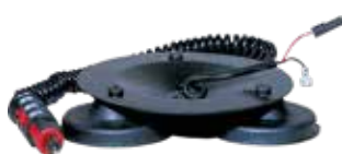
BASE B3M RTB/5 B3M BASE RTB/5 BASE B3M RTB/5