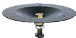
BASE P RTB/5 P BASE RTB/5 BASE P RTB/5