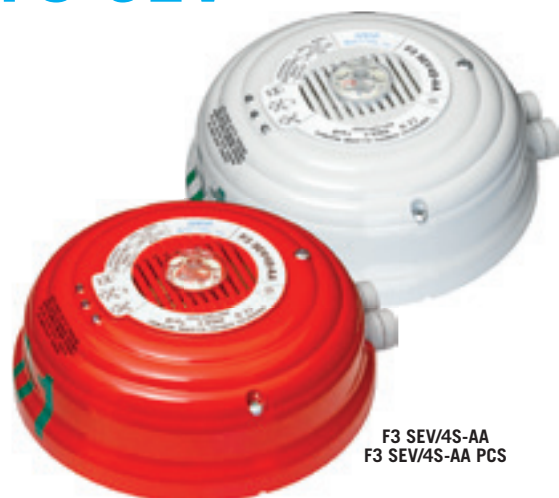
F3 SEV/4S-AA F3 SEV/4S-AA PCS